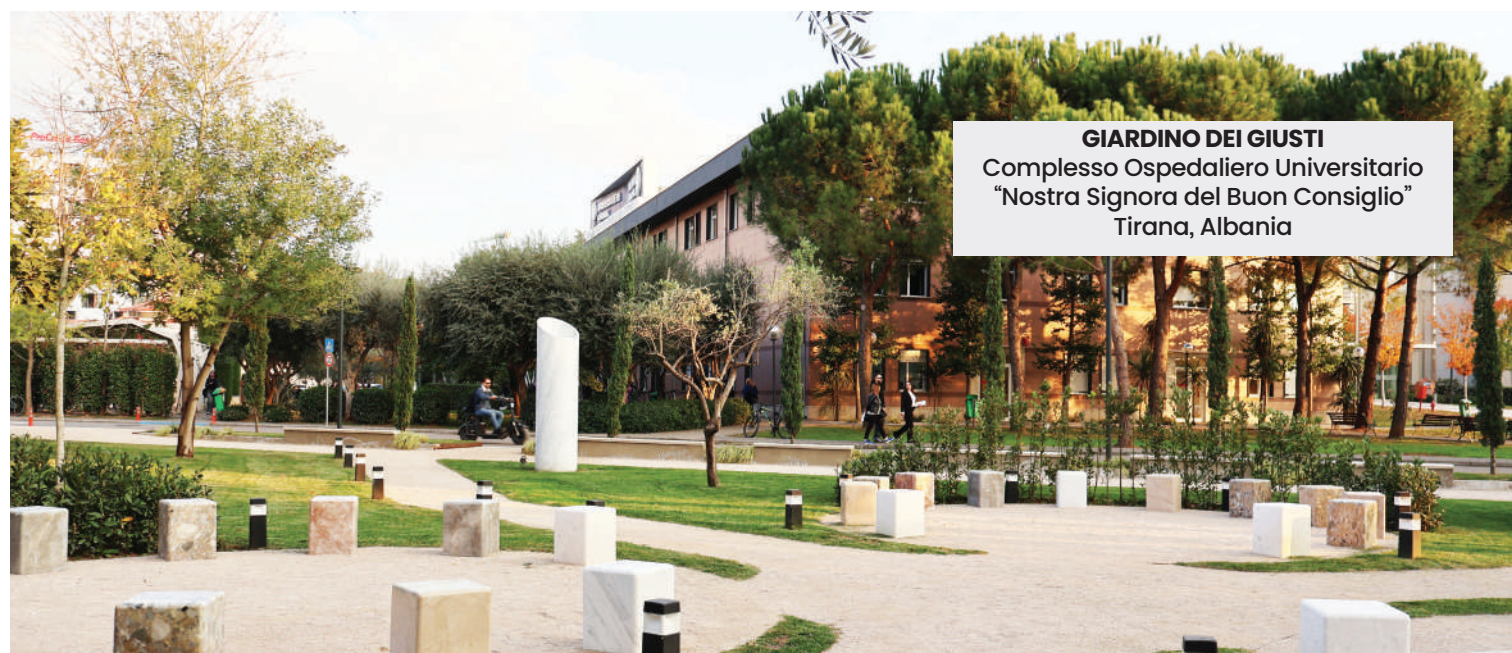
GIARDINO DEI GIUSTI Complesso Ospedaliero Universitario "Nostra Signora del Buon Consiglio" Tirana, Albania

I Giardini hanno il compito di presentare all'opinione pubblica, come esempio, coloro che, anche rischiando la vita, sono stati capaci di andare controcorrente e di custodire i valori umani di fronte a leggi ingiuste o all'indifferenza della società. Il primo "giusto" scritto su una pietra del Giardino è Carlo Urbani, con questa motivazione: "Medico infettivologo, per primo segnalò al mondo l'epidemia di SARS- CoV-1 (2002-03). Colpito dal virus, morì a Bangkok il 29 marzo 2003 a 47 anni. Diede prova di competenza e responsabilità nelle sue missioni umanitarie, senza frontiere e donando interamente sé stesso".