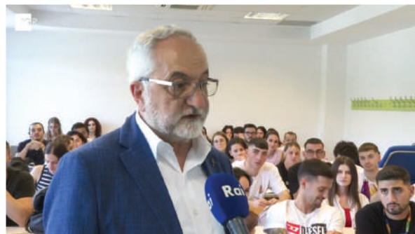
Tirana - Albania