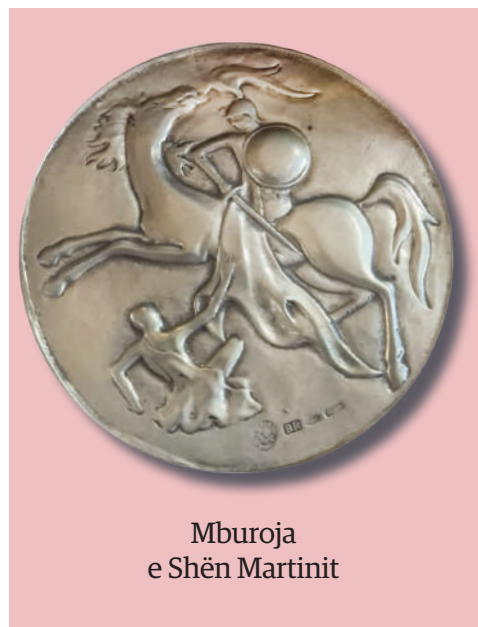
Mburoja e Shën Martinit